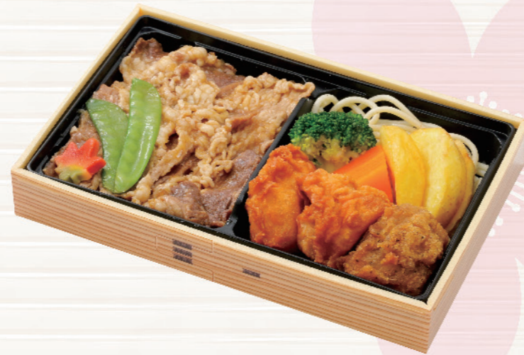
6771 牛すき焼きとりから弁当