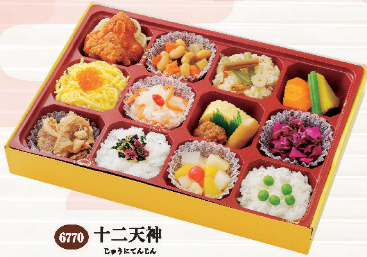
6770 十二天神 じゅうにてんじん