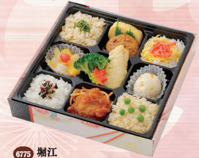
6775 堀江 ほりえ