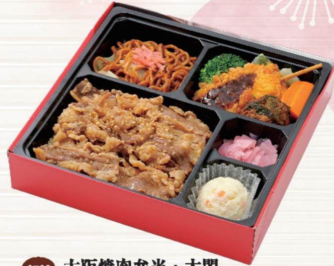
6763 大阪焼肉弁当・太閤 たいこう