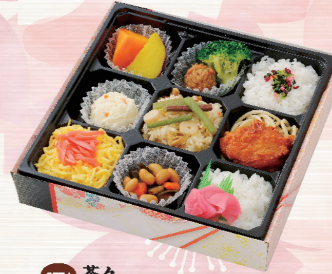
6774 茶々 ちやちや