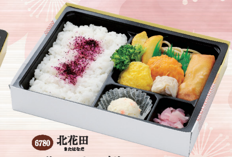
6780 北花田 きたはなだ