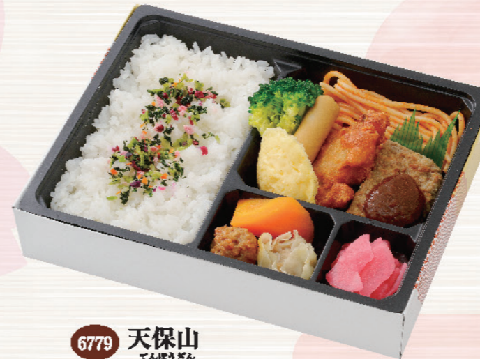
6779 天保山 てんぼざん