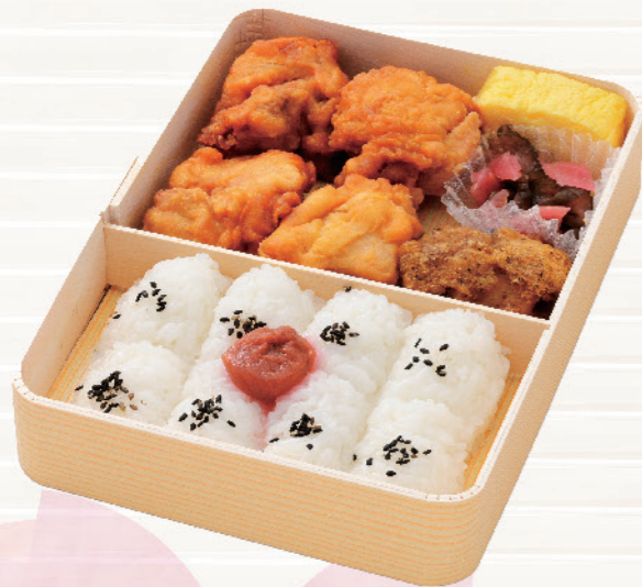
6766 鶏の味三昧！唐揚げ弁当